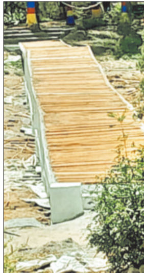
लकड़ी से बनाया गया पुल।

बिलासा ताल में सबसे अधिक परेशानियां असामाजिक तत्वों और मवेशियों से हो रही थी, जो बाउंड्रीवाल नहीं होने के कारण कहीं भी अंदर प्रवेश कर रहे थे। विभाग ने बिलासा ताल के चारों ओर सीमेंट की दीवार उठाकर बाउंड्रीवाल बनाने का काम शुरू किया गया। यह कार्य केवल सड़क की ओर से किया गया है, जहां चार से पांच फीट दीवार उठाकर उसे रंग रोगन का काम हुआ है। वहीं जिस ओर लोगों के निवास स्थान हैं उस स्थान पर बाउंड्रीवाल नहीं करने के कारण असामाजिक तत्वों का आना जाना लगा रहता है।