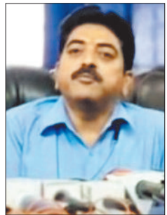
पत्रकारों से चर्चा करते पिता।

पलीटैक्निक कालेज में पढ़ने वाले नाबालिग के पिता ने आरोप लगाया है कि बेटे के दोस्तों ने डरा धमकाकर उससे घर में नकली सोना रखवाकर असली 60 से 70 लाख रुपए के सोने के जेवर व 2.50 लाख रुपए चोरी करवा लिया। उन्होंने पुलिस के उच्च अधिकारियों से चोरी गए सोने के जेवर व पैसा वापस करवाने की गुहार लगाई है। उन्होंने सकरी पुलिस पर कार्रवाई नहीं करने व समझौता कराने का आरोप लगाया है।