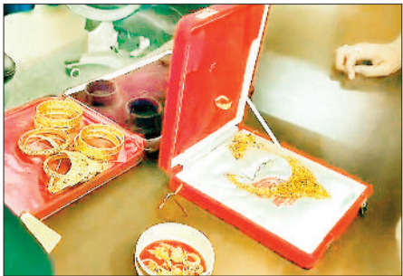
आरोपी से जब नकली सोना।

पलीटैक्निक कालेज में पढ़ाई कर रहा है। उसकी पत्नी कैसर पीड़ित हैं। उन्होंने आरोप लगाया है कि उनके नाबालिग बेटे के साथ पढ़ाई करने वाले उसके दो