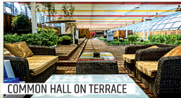
COMMON HALL ON TERRACE